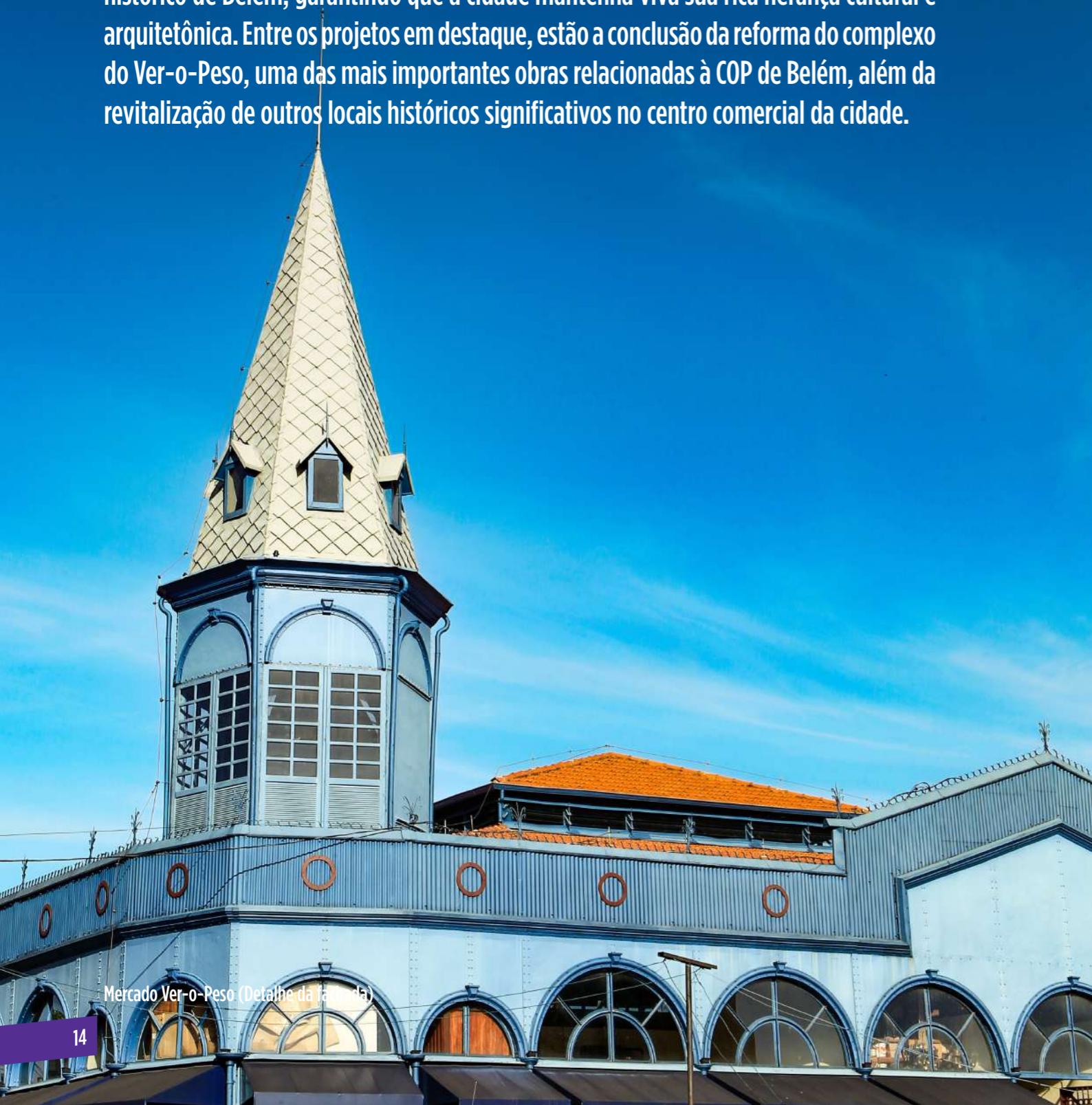
Mercado Ver-o-Peso (Detalhe da Torre)