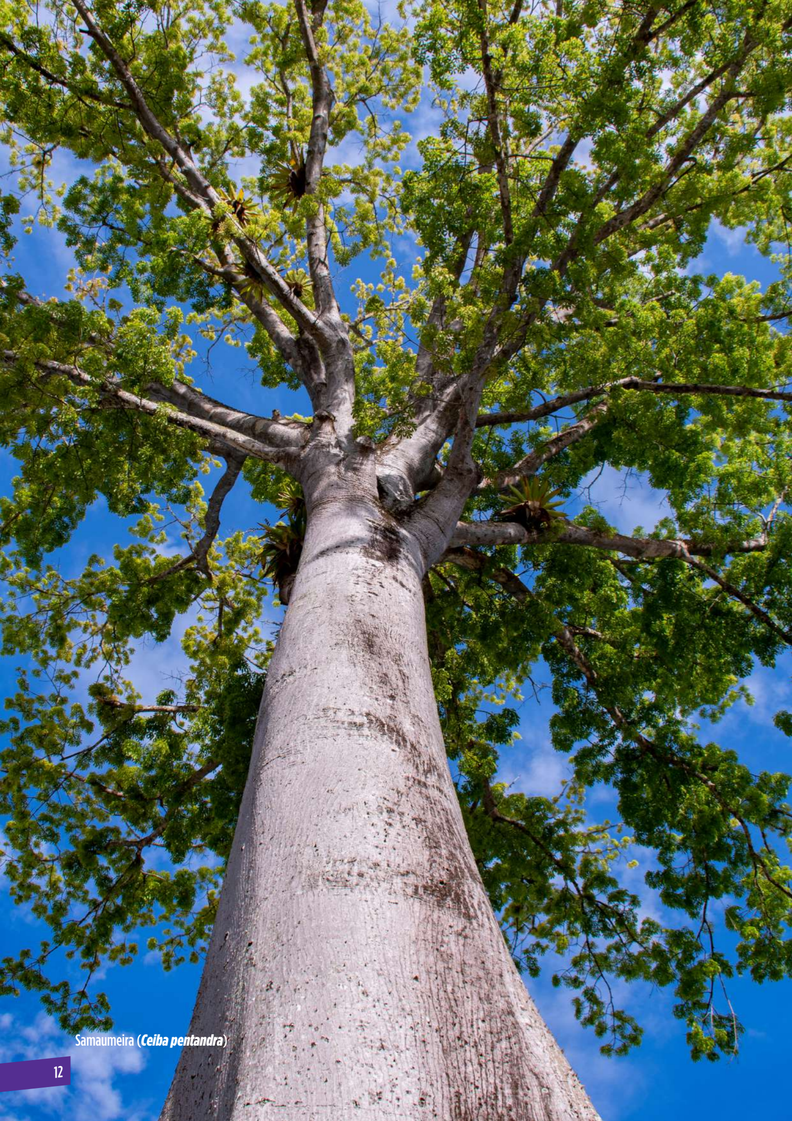
Samaumeira ( Ceiba pentandra )